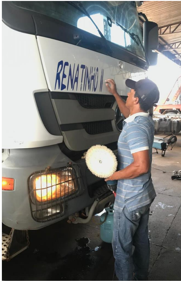
Imagem do primeiro caminhão próprio destinado ao transporte de rochas e o início das atividades de prestação de serviços junto à Mineração Serra Dourada.

Paralelamente às atividades desenvolvidas junto à mineração, a empresa passou a prestar serviços ao Poder Público Municipal, mediante participação em processos licitatórios, especialmente voltados à manutenção de estradas vicinais no município de Cocalinho/MT. Esses contratos contribuíram significativamente para o aumento do volume de serviços prestados e para o crescimento do faturamento.