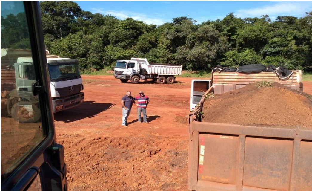
Imagem nas estradas vicinais do Município de Cocalinho/MT.

Com o aumento da demanda, tornou-se necessária a expansão da frota e a contratação de novos colaboradores. Nesse período, a empresa contou com uma equipe operacional estruturada, ainda que parte relevante dos equipamentos utilizados fosse proveniente de terceiros, mediante contratos de locação.