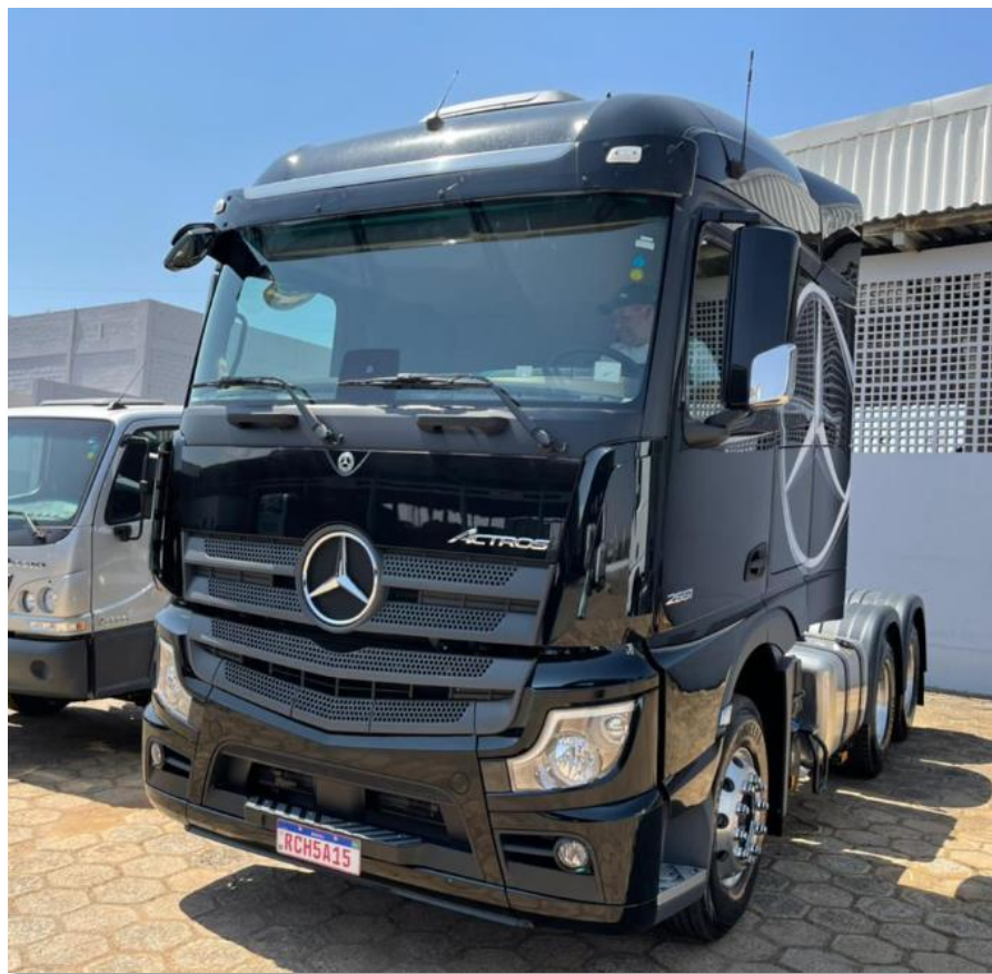
Imagem do primeiro caminhão rodoviário para transporte de grãos, brita e calcário.

Nesse contexto, registra-se a aquisição do primeiro caminhão rodoviário da empresa, destinado ao transporte de grãos, brita, calcário e demais cargas correlatas, fato que ampliou significativamente sua capacidade operacional e o escopo dos serviços prestados.