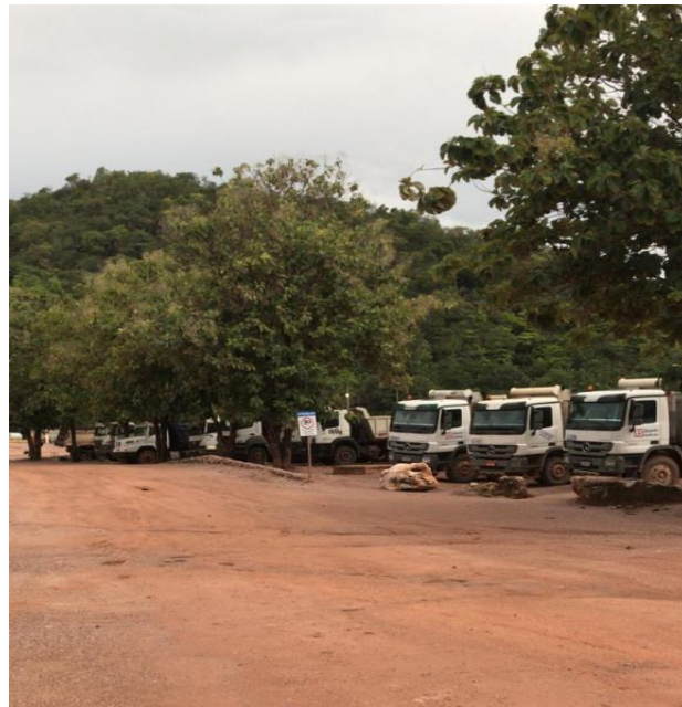
Imagem que demonstra a frota utilizada à época, composta por 3 (três) caminhões de propriedade da empresa e demais veículos pertencentes a terceiros, utilizados mediante contratos de locação.

Com o aumento da demanda, tornou-se necessária a expansão da frota e a contratação de novos colaboradores. Nesse período, a empresa contou com uma equipe operacional estruturada, ainda que parte relevante dos equipamentos utilizados fosse proveniente de terceiros, mediante contratos de locação.