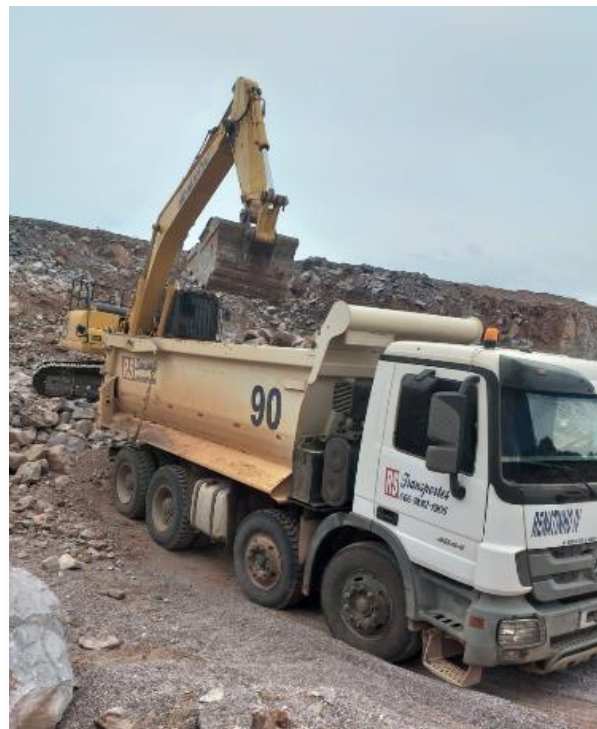
Atuação na mineração